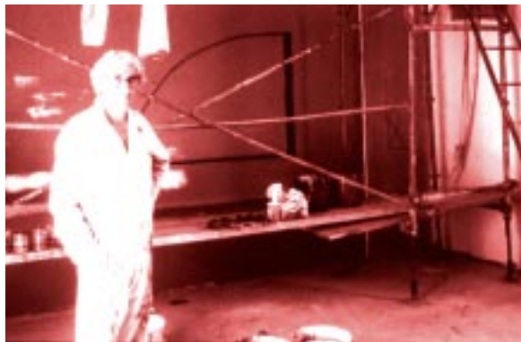
Àlbert Ràfols-Casamada durant el procés de realització del Mural Escola Eina (1994) Temple sobre tela 430 x 510 cm

En el mateix acte també es va concedir el Premi Nacional de Cultura en l'apartat de Disseny que, en la seva primera edició, ha premiat Daniel Giralt-Miracle pel comissariat de la mostra "Gaudí. Art i Disseny", així com pel comissariat de l'Any Gaudí 2002.