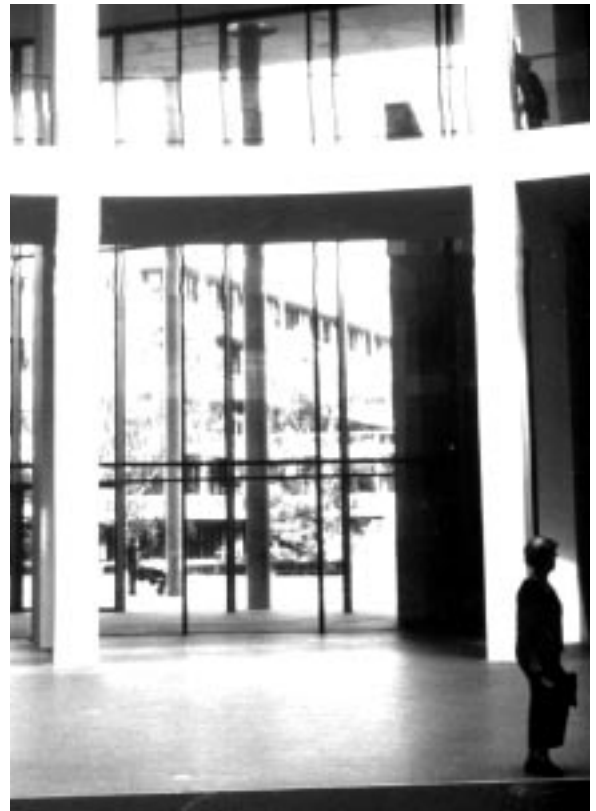
Leonardo da Vinci custodiada en el Museu del Louvre sota rigorosíssimes mesures de seguretat.

Però en el cas del disseny em remeto al conegut assaig de Walter Benjamin L'obra d'art en l'època de la seva reproductibilitat tècnica , on es fa una interessantíssima reflexió sobre el concepte d'"aura" en l'obra d'art. Benjamin defineix l'"aura" com aquella sensació de distància o llunyania que experimentem davant d'una obra única i irrepètible, que possiblement mai no podrem posseir ni tocar. Aquesta llunyania no l'experimentem amb les obres reproduïdes industrialment perquè no són úniques, ni irrepètibles, i perquè les podem adquirir i tocar amb relativa facilitat. La majoria d'objectes d'art que contemplem en els museus són "auràtics" i n'hi ha prou que ens els posin en una vitrina o en una paret ben il·luminades perquè despertin en nosaltres un sentiment d'admiració. Tots sabem que no ens produeix la mateixa sensació contemplar una de les infinites fotografies de la Gioconda en forma de cartell, calendari i làmina, per més fidel que sigui la reproducció, que contemplar l'enigmàtica obra original, única i irrepètible de