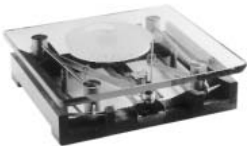
Bàscula de bany Lolaluna. Candela Reymundo, 1996 Productora: Rapseil, s.p.a. Milán, Itàlia. Distribució en Espanya: Arquitect

OP Vist en perspectiva, en els anys 1980 es va donar una definició força precisa del disseny que es feia a Catalunya, definició que situava en el centre del sector el disseny de mobiliari. Quins serien els referents actuals?