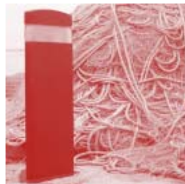
Llum Finisterre de Joan Gaspar per a Santa & Cole