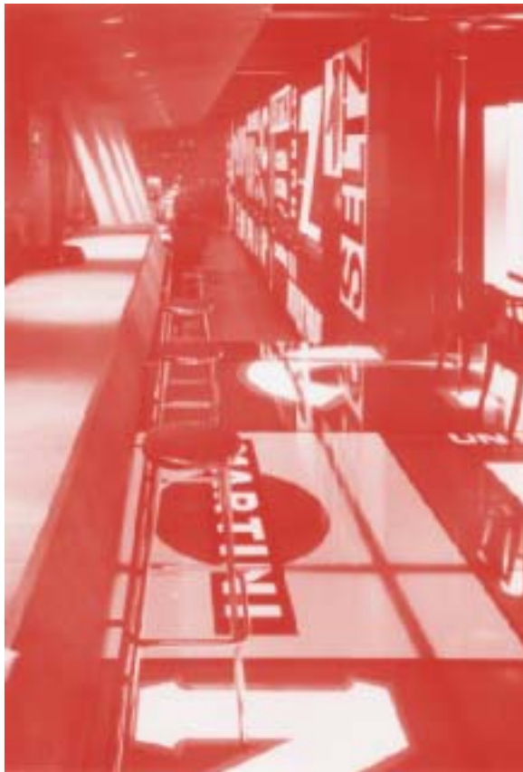
Interior del bar d'aperitius i tapes Seltz -Premi FAD d'Interiorisme i Premi de l'Opinió-, pioner en l'aplicació intensiva de la gràfica en el disseny de l'espai.

En tinc un record inesborrable. És un record viu. Com els bons amics, que no els veus en dos anys i quan els trobes tot és fluid. Aquí vaig fer les primeres classes de la meua vida. Era el 13 d'octubre de 1975, aquell dia només veia ulls que miraven. S'estava morint en Franco i en aquells anys hi havia moltíssima esperança en tothom, els alumnes, els professors, tothom. Vaig aprendre a no tenir algunes pors que no em calien i a tenir-ne d'altres que sí que em calien. Vaig veure que poc monolítica que és una classe de projectes. La diversitat i la dialèctica formaven un teixit de discussió que em va fascinar. Era un món molt poc simple però alhora molt senzill. S'havia d'ajudar a mirar, a dubtar i a escollir. Em queden amics i amigues inseparables, una lleu olor de jardí i la sensació d'haver recollit mirades i d'haver-ne sembrat d'altres.