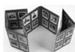
De la gente