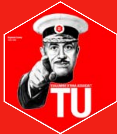
Imatge de promoció de l'Associació d'Exalumnes concebuda per la Junta Directiva

Si voleu més informació podeu adreçar-vos a deina@eina.edu