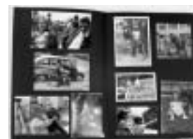
De la memoria