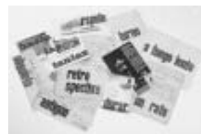
De la comunicación